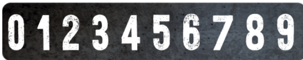
Ilustración 4 – Número Parabrisa y luneta en blanco.